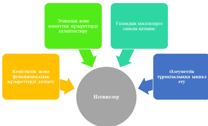
Сурет 3 - Халықаралық ұйымдардың қызметін халықтың әлеуметтік тұрақтылығына әсерін география пәні аясында оқытудың маңызды аспектілері [11]

- Әлеуметтік тұрақтылыққа ықпал ету. Халықаралық ұйымдардың жұмысын зерттеу оқушыларға қоғамдағы әлеуметтік үйлесімділік пен бейбітшілік идеяларын түсінуге мүмкіндік береді. Бұл олардың әлеуметтік тұрақтылықты бағалау және оны қолдауға қатысу қабілетін арттырады.