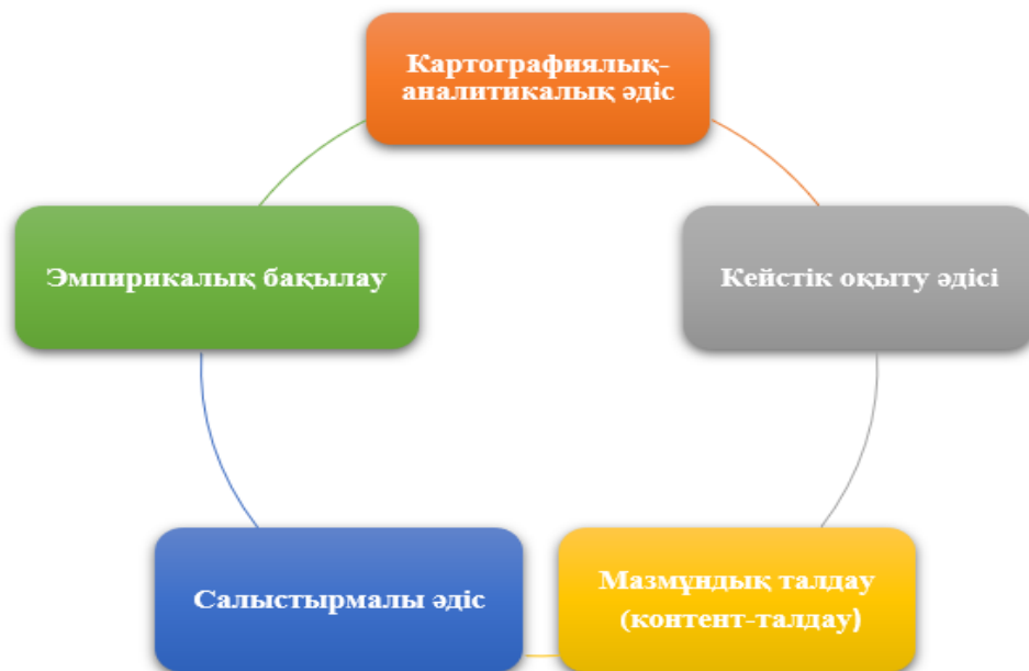
Сурет 1 - Практикалық зерттеуде қолданылатын әдіс түрлері

Практикалық зерттеулерде бірнеше әдіс кешенді түрде пайдаланылды (сурет 1):